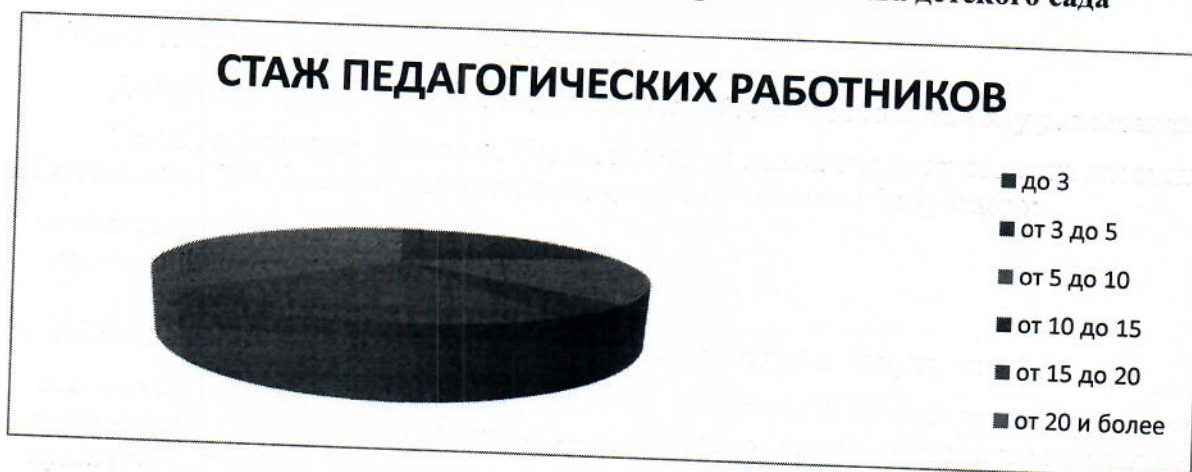
Диаграмма с характеристиками кадрового состава детского сада

На 30.12.2022 2 педагога проходят обучение в ВУЗах по педагогическим специальностям, один педагог обучается в педагогическом колледже.